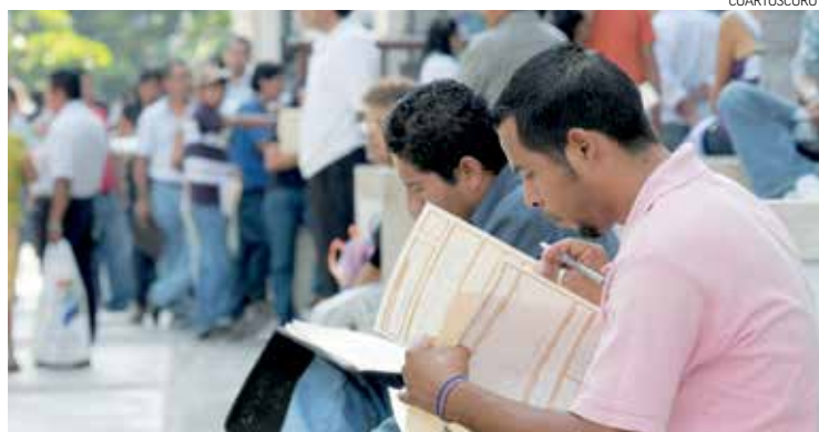
EXPECTATIVA. Al cierre de este año se prevé que se generen 70 mil puestos.