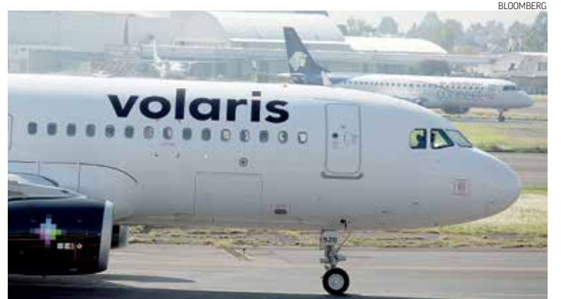
FACTOR. La apertura de nuevas rutas de Volaris y VivaAerobus impulsan desempeño.

“Seguimos definiendo a qué otras áreas del país podemos llegar, lo que queremos es atender la creciente demanda que existe en el mercado. La apertura de gasolineras se dará conforme el desarrollo de infraestructura”, detallaron. (Redacción).