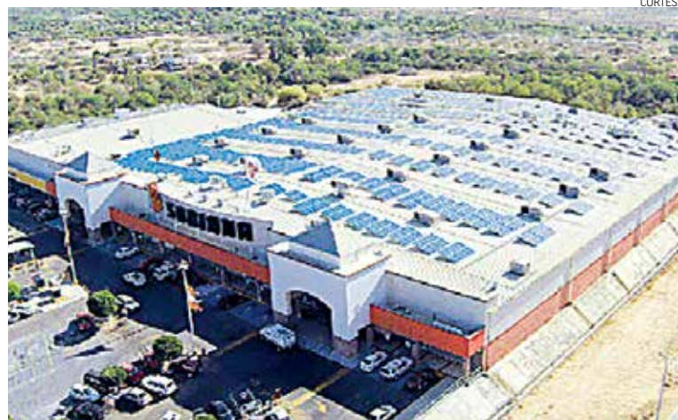
CONSUMO. La empresa se abastece de la energía solar, eólica y ciclo combinado.

El análisis indica que en 2016, el consumo de energía eléctrica obtenida por la fuente solar, representó un 0.66 por ciento del total; mediante el ciclo combinado un 10.68 por ciento; a través de la eó-