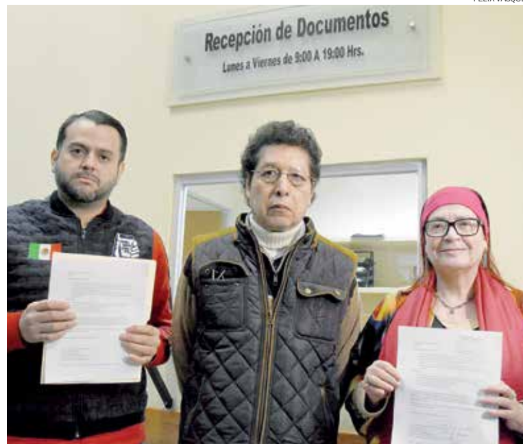
EXHORTO. Redes Quinto Poder pide que se haga una discusión pública del Paquete Fiscal 2018.

En el desglose de este gasto, llama la atención el aumento solicitado en el concepto de “Pasajes aéreos”, pues de los 15 millones 46 mil pesos aprobados para este año, ahora el Gobierno estatal está pidiendo 22 millones 736 mil pesos