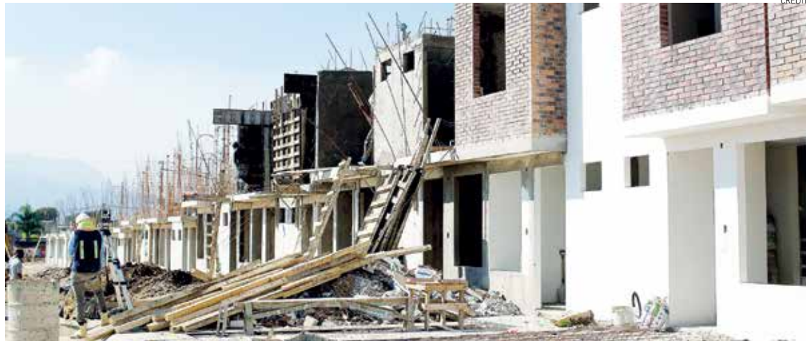
PANORAMA. Los empresarios prevén una tendencia a la baja con un entorno incierto.

Al presidir el “Encuentro estatal de vivienda 2017” organizado por