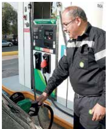
FACETA. El consumidor deberá verificar precio y servicio.