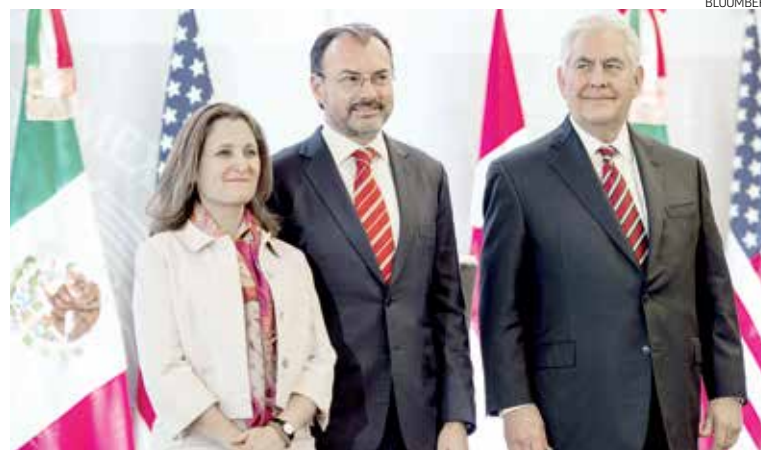
RESULTADO. La sexta ronda de renegociaciones mostró un lento avance.

Y añadieron que este escenario central ahora refleja cierta flexibilidad en cuanto a la secuencia. Los resultados de las rondas hasta ahora sugieren que la etapa de renegociaciones podría continuar más allá del primer trimestre de este año.