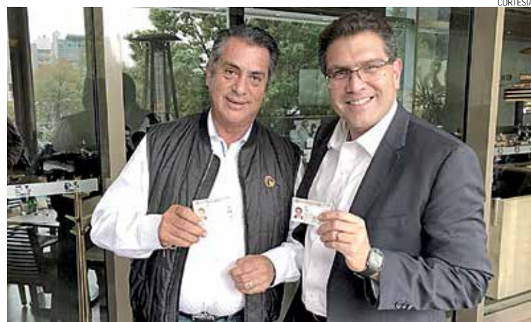
LUGAR. Los aspirantes a una candidatura independiente a la Presidencia se reunieron en un hotel del Paseo de la Reforma.

hay un movimiento independiente que se podría reunir en el mes de marzo y la ciudad de Aguascalientes es un buen lugar para encontrarnos. (El objetivo) sería proyectar una gran visión de que los independientes no son unos cuantos, sino que hay un gran movimiento a nivel nacional, que está en la intención de influir en el proceso electoral y esa es la visión que compartimos”, expresó Ríos Piter.