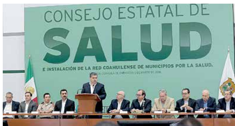
PREVENCIÓN. Se instaló ayer en la entidad el Consejo Estatal de Salud y la Red Coahuilense de Municipios por la Salud.