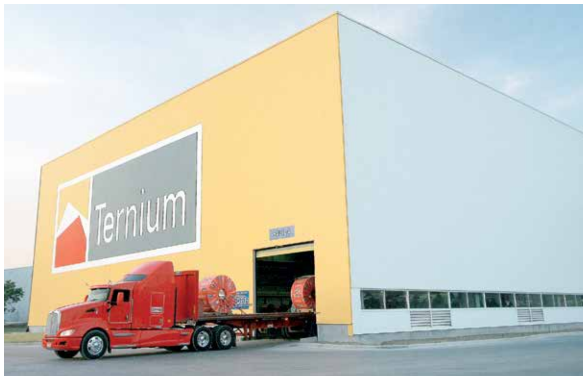
EXPECTATIVAS. La compañía siderúrgica ve un panorama favorable para este año, pese a la incertidumbre por el TLCAN.