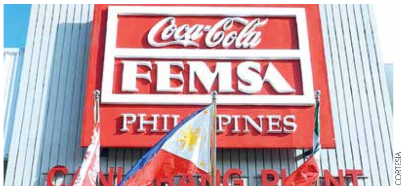
COMPOSICIÓN. Coca-Cola FEMSA (Kof) posee el 51 por ciento de CCBPI