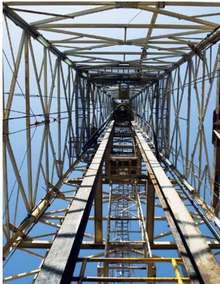
PANORAMA. El sector energético registrará este año una mayor inversión.

Destacó que con la Ley Antilavado hay muchas cosas que filtrar, ahora les piden todas las solicitudes y el gobierno las examina, existen muchas situaciones legales con que cumplir para no tener pro-