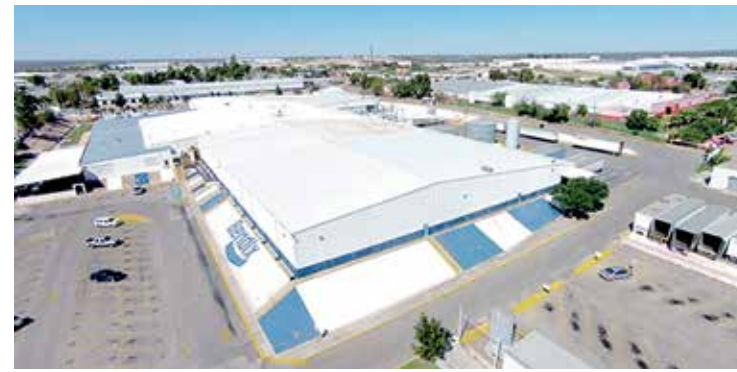
ARRIBO. La empresa llegó a México en 1988 al instalar su primera planta en Ciudad Acuña, Coahuila.

“La expansión de nuestra presencia en el área de ingeniería nos permitirá ampliar también nuestra presencia norteamericana para acercarnos más a nuestros clientes y mejorar aún más nuestro nivel de soporte en general”, añadió. — Redacción