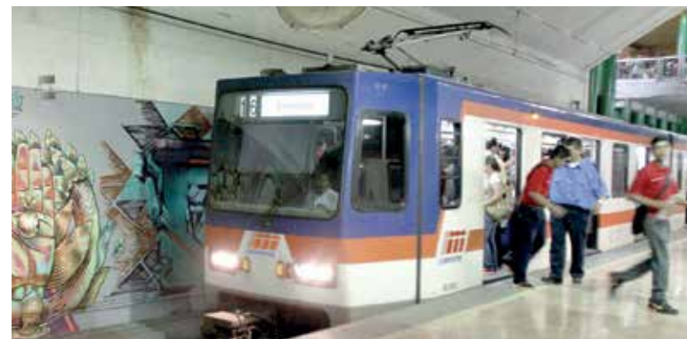
PRUEBA PILOTO. El programa Vagón Rosa tendrá una duración de cuatro meses.