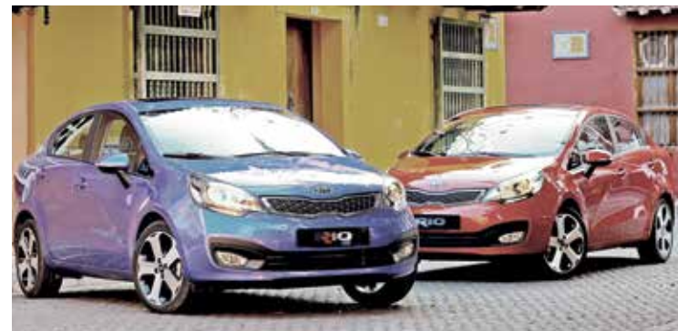
DESTACADO. En febrero, la empresa colocó siete mil 608 unidades, siendo liderados por el modelo KIA Rio.