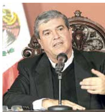
PROPUESTA. El Gobernador planeará en la CDMX uso de autopistas.