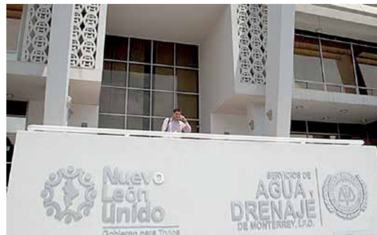
MEJORA. HR Ratings revisó al alza de HR A+ a HR AA- la calificación para SADM y ratificó la perspectiva estable.

Para el crédito con Banobras, que fue por un monto de mil 853.3 millones de pesos, destacó que éste