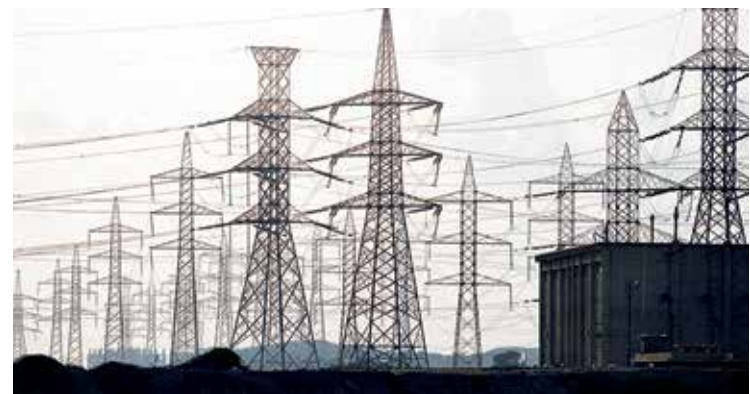
SITUACIÓN. La tarifa De Alto Consumo se encareció 1.2 por ciento en octubre.

Desde diciembre del año pasado entró en vigor el nuevo esquema de ajustes de las tarifas en base a costos.