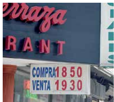
PANORAMA. Prevén una cascada de demandas que se ven venir con esta decisión.