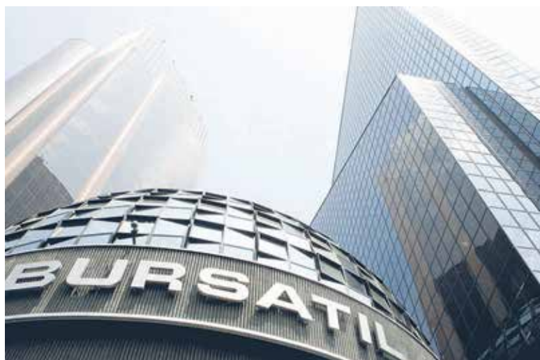
CONSECUENCIA. Banorte y OMA sufrieron las mayores bajas del listado de empresas regias, durante la jornada bursátil de ayer.