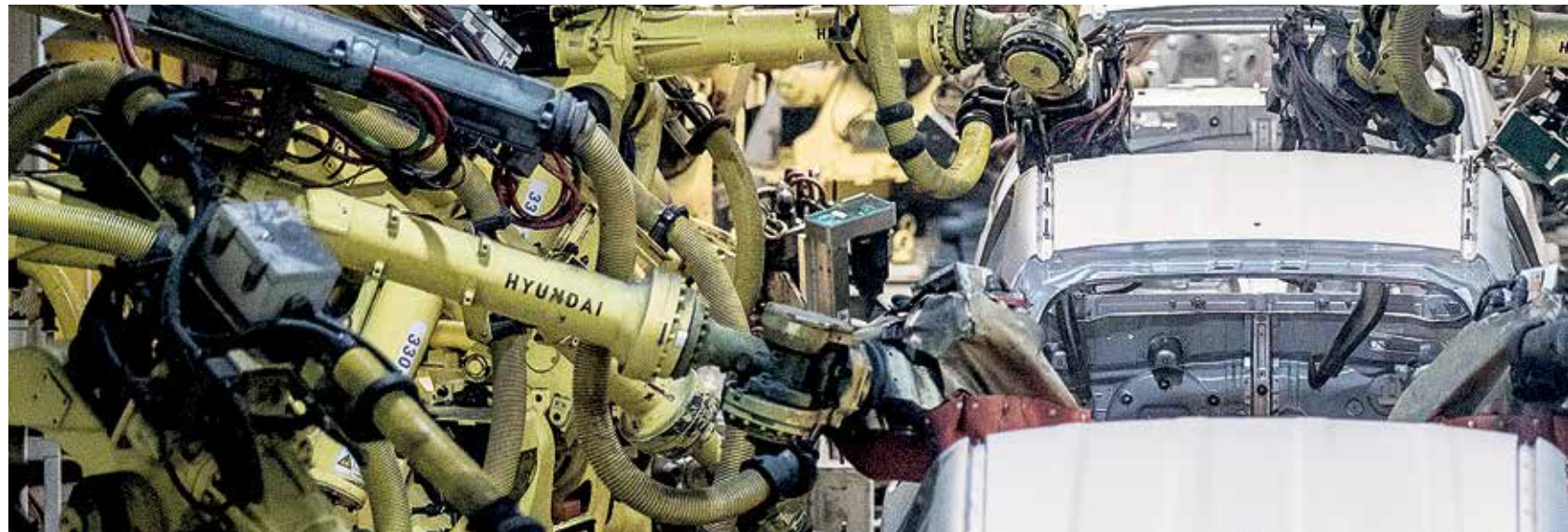
PANORAMA. La automatización y robotización estaría poniendo en riesgo al 52 por ciento de los empleos en México, según datos del Instituto Global McKinsey.

Dicho estudio realizado con base a una encuesta aplicada entre una muestra de 400 empresas ubicadas en el área metropolitana de Monterrey (AMM), arroja que sólo un 37.3 por ciento de las compañías han integrado algunos elementos de la