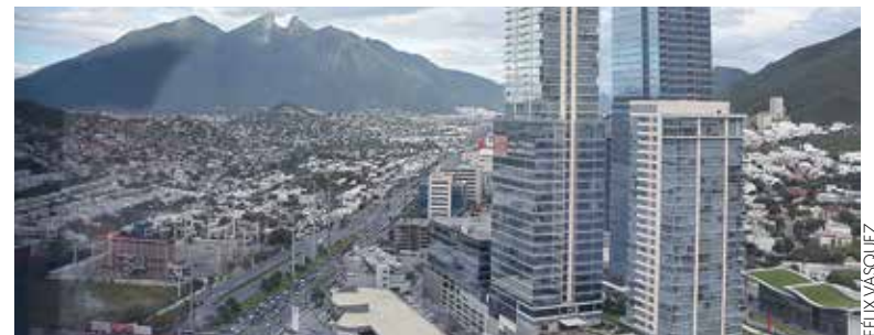
VULNERABLES. Una mala construcción sufriría daños con sismos de baja magnitud.

“En Nuevo León sí tiembla, sí hay sismicidad, y se presentan sismos